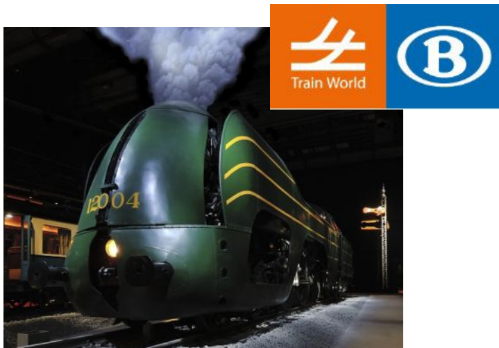
Pronkstuk van het museum: Stoomlocomotief type 12 1939, 89 ton, 2500 pk, max 140km/u.

Na de succesvolle uitstap van vorig jaar naar het Justitiepaleis en de Marollen trekken we dit jaar iets dieper Brussel in en opteren we voor Schaarbeek waar we onder begeleiding 'Train World' gaan bezoeken en in dezelfde buurt vinden we het winkelcentrum Docks Brussel. We plannen het ook op een zaterdag zodat echte werklieden er geen verlof hoeven voor te nemen.